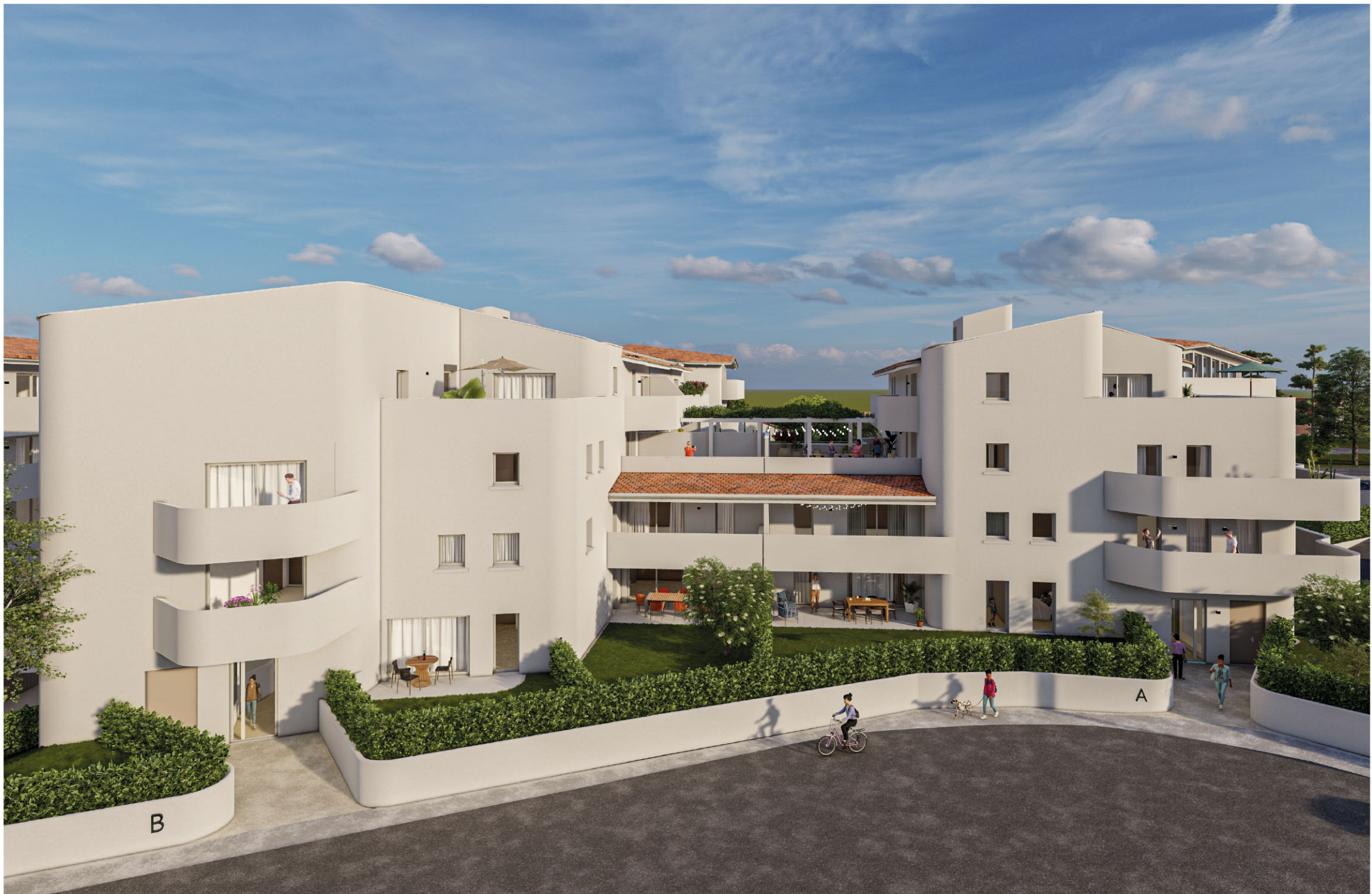
Vue depuis la rue de l'Estagnas